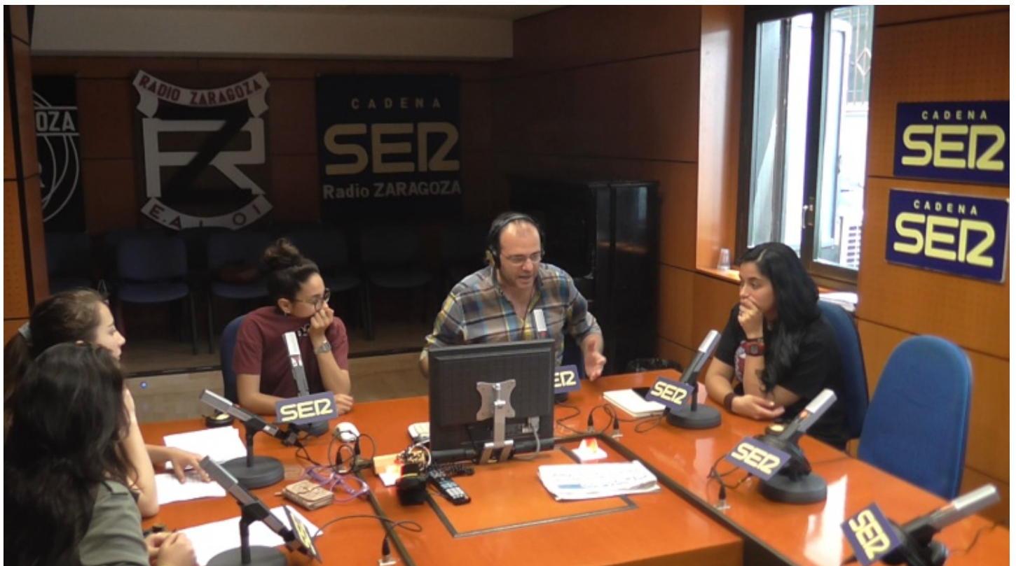
Las alumnas del IES Virgen del Pilar han participado en la tertulia de Hoy por Hoy Zaragoza / Cadena SER

Los zaragozanos que han participado en el IV Plan Joven debaten en la tertulia de Hoy por Hoy sus propuestas en materias como empleo, educación, emancipación, ocio o cultura