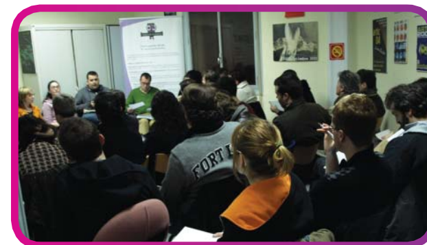
Asamblea de Acción Social y Juventud.

Por eso, si alguna vez habéis pensado tus colegas y tú en montar una asociación de lo que te venga en gana, que sepas que todo este material está a tu disposición para que empecéis con buen pie.