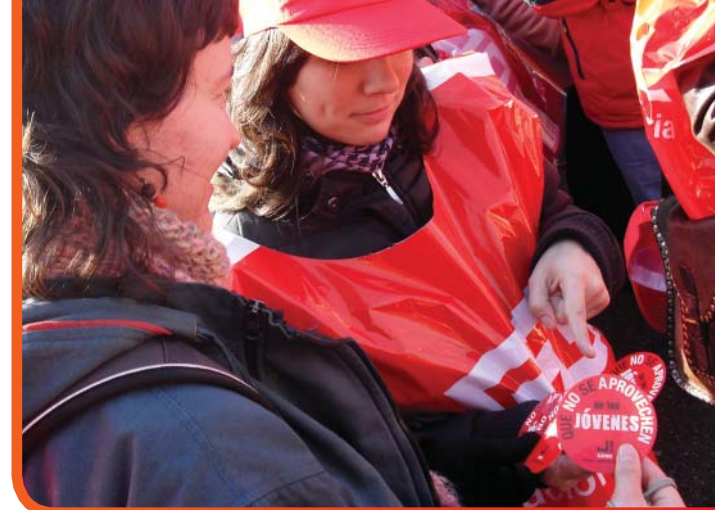
Manifestación 12 del 12 a las 12. Madrid.

La educación, centrándonos en exclusiva en la formación profesional del individuo, debe de ser la llave que nos permita acceder a la categoría profesional que nos corresponde así como también es indispensable que el trabajador disponga de canales de formación dentro de su empresa para el ascenso dentro de la misma. Creemos desde USO que quedarnos parados en nuestra formación es un error en el que no podemos caer y que siempre es un valor añadido a la hora de aspirar a un puesto. Sabemos que no estar preparados solo nos hace caer en una espiral de precariedad aún mayor, no hay más que ver el alto porcentaje de desempleados no cualificados jóvenes que tenemos en las estadísticas del Observatorio