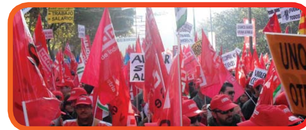
Manifestación 12 del 12 a las 12. Madrid.

en los centros escolares, sobre todo en los cursos finales de cada ciclo educativo.