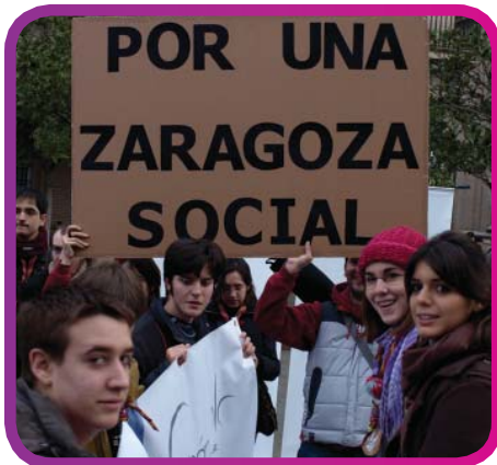
Acto reivindicativo del Día de San Valero. 29 de Enero de 2009.

En octubre llegó la gran fiesta en la calle, la VII Feria del Asociacionismo Joven. Todos juntos compartimos tres días de música, stands, actividades, talleres, charlas, documentales... pero lo más importante fue la posibilidad de compartir un espacio y hablar de manera informal de cómo podíamos cambiar y mejorar nuestra ciudad. Como de costumbre, la prensa sólo hablaba del botellón. La feria se realizó en la Plaza de Los Sitios, así que compartíamos espacio nocturno con los botelloneros. Fue un intercambio del que aprendimos todos algo y empatizamos los unos con los otros. En noviembre comenzó la formación, porque