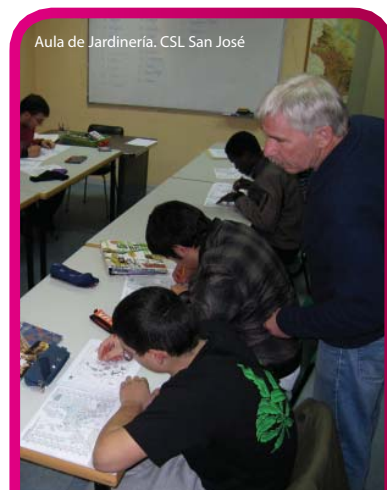
Aula de Jardinería. CSL San José

Si pudiérais volver atrás, ¿cambiaríais algo de vuestro paso por el sistema