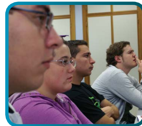
XI Encuentro de Red de Consejos Locales. Zaragoza.

Parecía que no iba a acabar nunca, y cuando parecía que sí, todos a votar. ¿para qué, si eso no vale para nada? Pues no, hala votaciones, pero Dios es justo e hizo que se liaran, y que hubiera que repetir alguna. Así aprenderán.