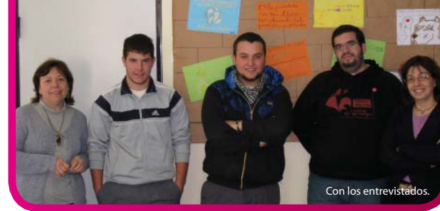
Con los entrevistados.

Nos comentan que todos los jóvenes lo tenemos igual, pero que “el problema es que ahora lo que se valora es la experiencia y nadie te da la oportunidad de adquirir esa experiencia