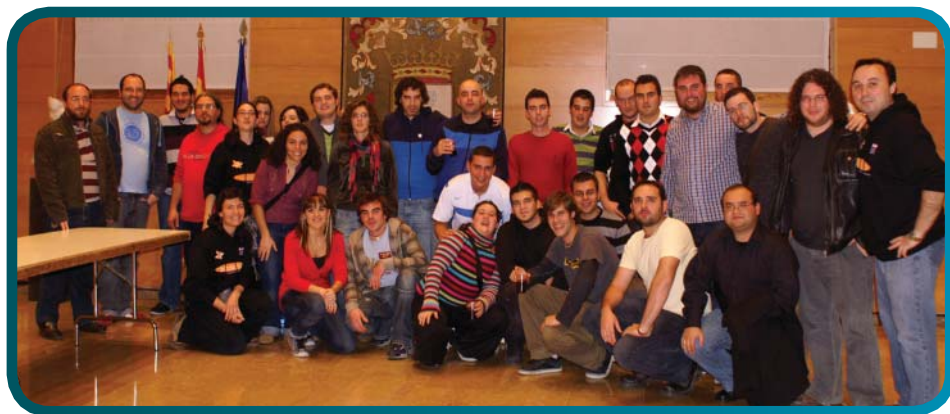
XI Encuentro de Red de Consejos Locales. Zaragoza.

Tarde llegamos, al menos el que me tocó a mí, pero chico, al día siguiente el muy xxxxx se me levanta temprano y se me lleva a trabajar en el mismo edificio, en la sede del IAJ, pero ahora en las salas. Pero estos están chalaos . Que es 6 de diciembre, que es fiesta y estás o tropecientos kilómetros de tu casa. Un taller sobre modelos de participación y nuevas tecnologías. Los mato. Un café (menos mal) y otra vez al tajo. Ahora no sé qué sobre experiencias de participación de jóvenes en la ciudad. Salían y explicaban los diferentes programas de participación juvenil que se