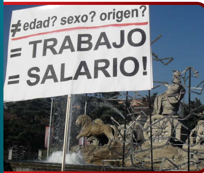
Manifestación 12 del 12 a las 12. Madrid.

Por todo ello, ante la actualidad informativa, hemos querido dedicar este boletín que tienes en tus manos a reflexionar acerca de la situación del empleo de l@s jóvenes, a desgarnar la situación de un mercado laboral voraz en el que somos, junto con otros colectivos, la parte desfavorecida.